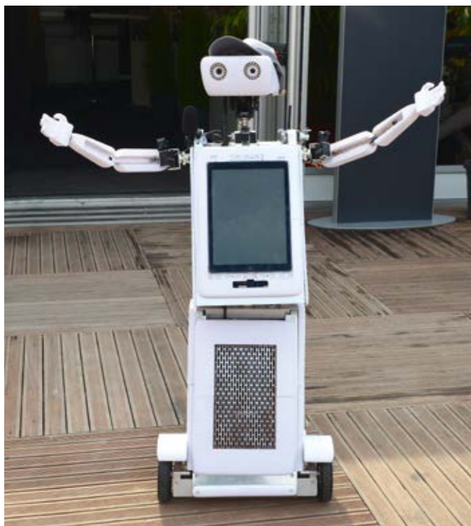
12 UNSER ROBBIE: HAT DIE KUNDEN PERSÖNLICH BEGRÜSST UND HATTE DIE LÄCHER IMMER AUF SEINER SEITE

Unser Fazit: Die Reise nach Neumünster hat sich mehr als gelohnt. Durch einen perfekt aufeinander abgestimmten Messeauftritt konnten wir wieder bei Ihnen punkten. Danke, dass Sie dabei waren.