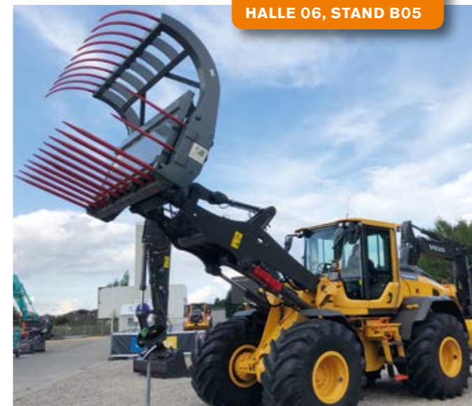
SCHON AUF DER NORDBAU PRÄSENTIERTE SICH UNSER L90H MIT „AGRI-AUSSTATTUNG“

AGRITECHNICA 2019 10.-16.11.2019 in Hannover Sie finden uns hier: HALLE 06, STAND B05