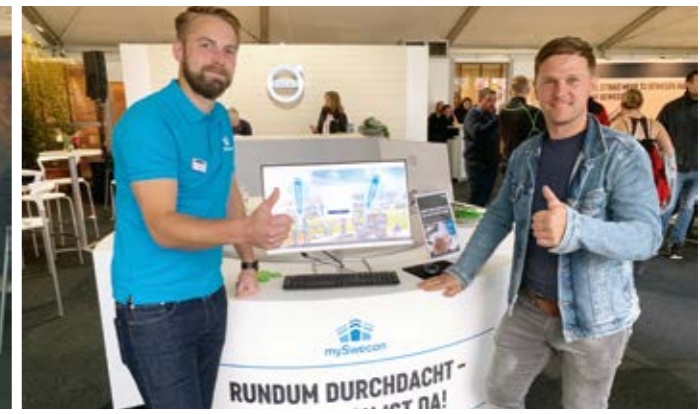
SO SEHEN REGISTRIERER AUS!