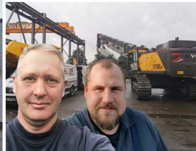
SELFIE VOR DEM EC750EHR