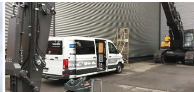
DIE VORBEREITUNGEN FÜR DEN ANBAU SIND ERLEDIGT