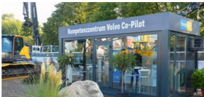
OPTIMALE DARSTELLUNG DER CO-PILOT-SYSTEME IM CONTAINER