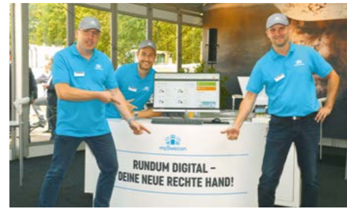
DAS MYSWECON-TEAM VOR ORT