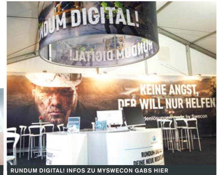
RUNDUM DIGITAL! INFOS ZU MYSWECON GABS HIER