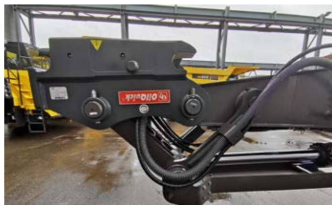
ANGEBAUTER OQ80 AM 36-METER-AUSLEGER!